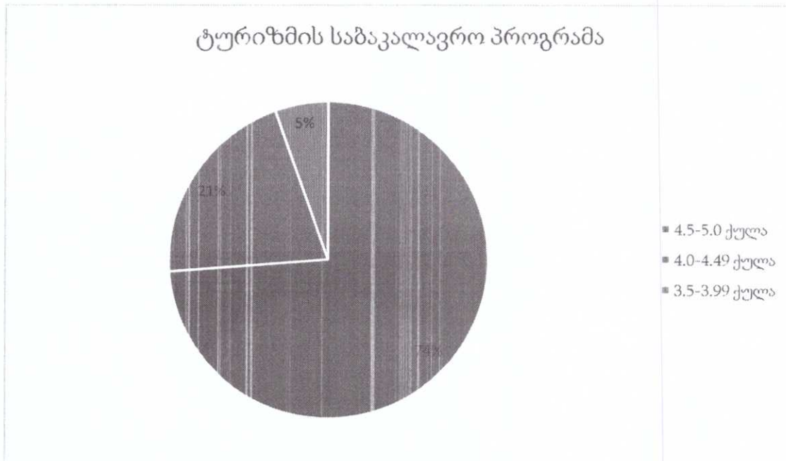
დიაგრამა 3. ტურიზმის საბაკალავრო პროგრამის სასწავლო კურსების შეფასება

ფაკულტეტის ხარისხის უზრუნველყოფის სამსახურის წარმომადგენლები მონაწილეობდნენ სხვადასხვა სახის ტრენინგ-სემინარებში სწავლების მეთოდებისა და ხარისხის უზრუნველყოფის საკითხების შესახებ, კერძოდ: